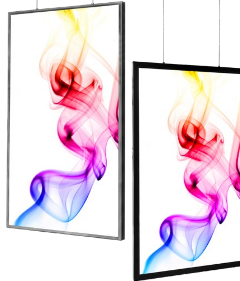
Der Bildschirm mit dem schönsten Rücken...

Ausgestattet mit einer homogenen und energiesparenden LED Beleuchtung , machen Sie das Display auch im Innenbereich zum Eye-Catcher.